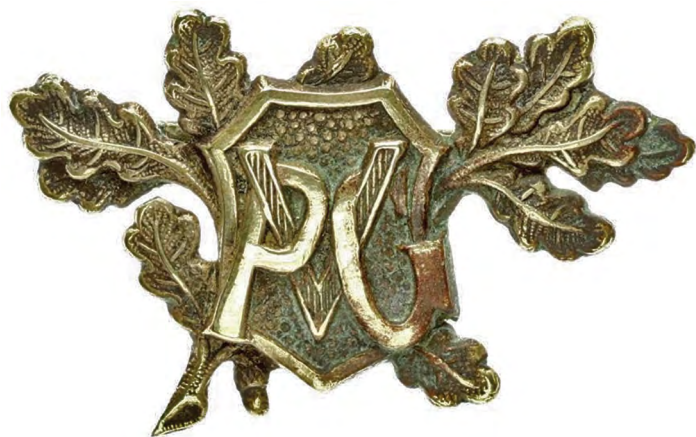
3 pav. J. Zikaras. Panevėžio vyrų gimnazijos ženklas, ~1921 m., 23 × 34 mm. Privatus rinkinys

berniukų – Panevėžio vyrų gimnazijos ženklą 37 . Detalesnis ženklelių aprašymas nepateiktas, bet jų išvaizda žinoma iš nuotraukų ir išlikusių daiktų (3 pav.). Nustatytos uniformos pradžioje nebuvo privalomos. Nuo 1924 m. balandžio 23 d. Švietimo ministerija visoms aukštesniosioms ir vidurinėms mokykloms įvedė privalomą uniformą su nustatytu kepurinių ženklų. 1924 m. rugpjūčio 25 d. Panevėžio valstybinės gimnazijos mokytojų tarybos posėdyje buvo nuspręsta mokinių kepurėms palikti tuos pačius ženklelius, kuriuos jau anksčiau buvo suprojektavęs J. Zikaras 38 .