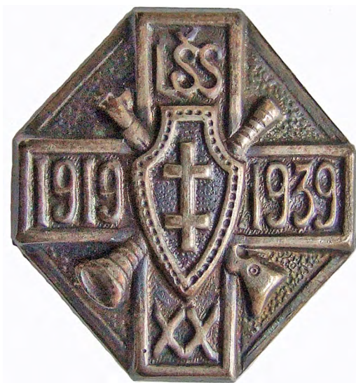
5 pav. J. Zikaras. Lietuvos šaulių sąjungos jubiliejinis ženklelis, 1939 m., 23 × 21 mm. LNM, M 5435