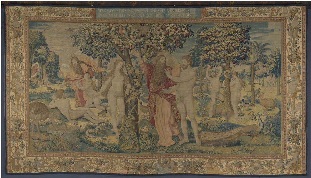
2 pav. „Rojaus laimė“, Michielis Coxcie'is, Jano de Kempeneero audimo dirbtuvės, Briuselis, apie 1550 m., 480 × 854 cm. Zamek Królewski na Wawelu – Państwowe Zbiory Sztuki.

Šis istorinis dokumentas leidžia teigti, kad „Pirmųjų tėvų istorija“ ir „Nojaus istorija“ buvo užsakytos 1547 m. Vilniaus Žemutinės pilies Lietuvos didžiųjų kunigaikščių rūmuose, o sumokėta buvo iš Lietuvos didžiojo kunigaikščio dvaro išdo.