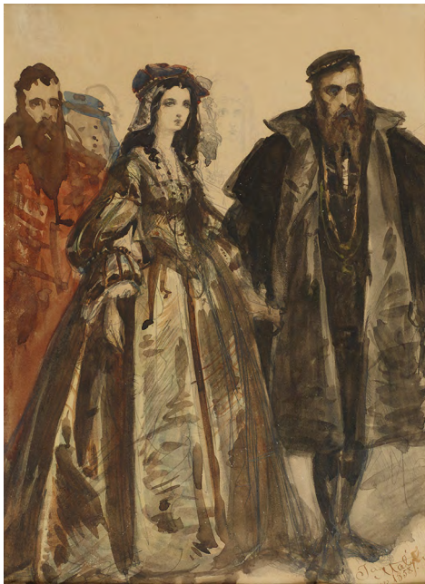
5 pav. „Žygimantas Augustas, pristatantis Barbarą Radvilaitę“, Janas Mateika, 1858 m., 32 x 23,5 cm., Muzeum Narodowe w Krakowie

Įvardyti faktai ir artefaktai aiškiai byloja, kad 1543–1549 m. Žygimantas Augustas turėjo gausią gobelenų kolekciją, kuri dažnai puošė vilnietišką ir kitas valdovo rezidencijas LDK. Paimta rezidencija buvo toliau puošiamą bei puoselėjimą ir jam tapus Lenkijos karaliumi (1548). Po 1549 m. įrašai nutrūksta. Tai neturėtų stebinti. Mirus Žygimantui Senajam (1548 m. balandžio 1 d.), jo įpėdinis Žygimantas Augustas tapo visateisiu Lietuvos didžiuoju kunigaikščiu ir Lenkijos karaliumi. Jo laukė valdžios įteisinimas abiejose valstybėse ir dvaro reorganizavimas. Be to, nuo pat valdymo pradžios svarbiausias valdovo tikslas buvo pristatyti savo išrinktąją Barbarą Radvilaitę kaip teisėtą karalienę. 1547 m. gruodžio 15 d. Piotrkuvo Seime valdovas oficialiai paskelbė apie įvykusias savo ir Barbaros vestuves. 1548 m. balandžio 17 d. įvyko jaunosios karalienės pristatymas ir įvedimas į Lietuvos didžiųjų kunigaikščių rūmus Vilniaus Žemutinėje pilyje. 1548 m. rugsėjo 1 d., valdovo pakviesta, Barbora atvyko į Vavelį, kur buvo karūnuota 1550 m. gruodžio 7 dieną. Vavelis tuo metu visų pirma atliko valstybinę funkciją – buvo svarbiausia valdovo rezidencija, o Nepolomicės buvo labiau susijusios su privačiu Žygimanto Augusto gyvenimu. Sudėtingas ir audringas politinis bei asmeninis gyvenimas kovojant dėl mylimos žmonos pripažinimo ir gyvybės (Barbora mirė 1551 m. gegužės 8 d.), tikėtina, nebuvo palankus naujiems užsakymams. Mirus Barbarai