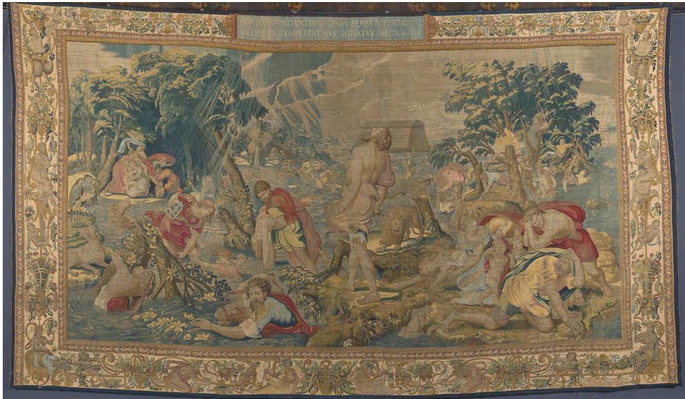
3 pav. „Tvanas“, Michielis Coxcie'is, Briuselis, apie 1550 m., 482 × 842 cm. Zamek Królewski na Wawelu – Państwowe Zbiory Sztuki.