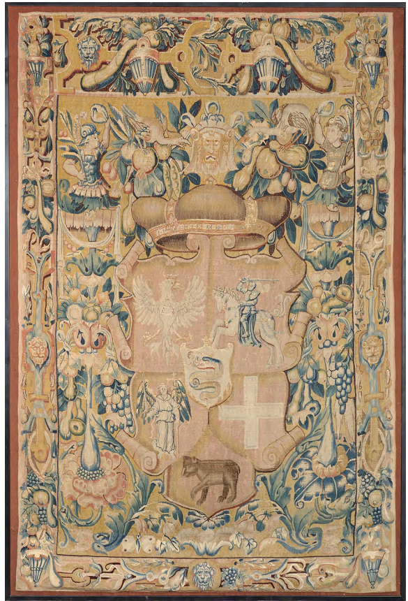
4 pav. Gobelenas su Lietuvos didžiojo kunigaikščio Žygimanto Augusto jungtiniu herbu, Flandrija, apie 1544–1548 m, 240 × 158 cm. Nacionalinis muziejus Lietuvos Didžiosios Kunigaikštystės valdovų rūmai .

Gobelenų iškabinimas Vilniaus Žemutinės pilies rūmuose minimas ir 1549 metais. 1549 m. sausio 5 d. sumokėti 3 grašiai už plaktukėlį gobelenams kabinti 83 , sausio 30 d. sumokėti 4 grašiai už nenurodytą skaičių vinučių gobelenams kabinti 84 . Tokie pat įrašai kartojasi balandžio 8 d. – 3 grašiai 85 , gegužės 17 d. – 6 grašiai 86 , liepos 8 d. – 8 grašiai 87 , rugpjūčio 27 d. randami net du įrašai: 6 grašių išmoka už vinukus Jos Didenybės gobelenams kabinti ir 18 florenų už maskvietiškus gobelenus 88,89 . 1549 m. spalio mėn. gobelenai minimi du kartus. Spalio 18 d. už vinukus gobelenams kabinti išmokėti 6 grašiai, dar 6 grašiai išmokėti už vinukus gobelenams kabinti Jos Didenybės Karalienės kambariuose 90 . Lapkričio 12 d. sumokėta už vinukus gobelenams kabinti Nepolomicėse 91 .