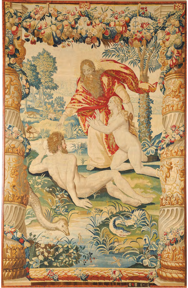
1 pav. „Adomo ir Ievos supažindinimas“, Jeano Leynierso audimo dirbtuvės, Briuselis, pagal Michielio Coxcie'io kartonus, XVII a. vid., 350 × 230 cm. Nacionalinis muziejus Lietuvos Didžiosios Kunigaikštystės valdovų rūmai.

Pasirinktą temą tyrinėjančioje XX a. paskutiniojo dešimtmečio ir XXI a. pradžios literatūroje Žygimanto Augusto gobelenai apibrėžiami kaip kolekcija, kurios išskirtinumas – užsakovo visumos koncepcija. Bibliiniai audiniai rodo valdovo domėjimąsi pasaulio sukūrimo istorija, verdiūros atspindėjo laikotarpio dvasią ir išskirtinį dėmesį gamtai, atitinkantį bendrąsias europinio humanizmo nuotaikas, o herbiniai ir monograminiai gobelenai turėjo liudyti valstybės vienybę, šlovinti monarchą bei įgyvendinti politinę programą ir valdžios atstovavimo ar jos demonstravimo idėją. Meninis šios kolekcijos lygis ir sumanymo mastas tebėra neprilygstami. Tiek verdiūrinių gobelenų viena tema niekas iki tol nebuvo užsisakęs. Gobelenų Senojo Testamento temomis įvertinimą rodo ir tai, jog bėgant amžiams „Nojaus istoriją“ kartojančių gobelenų buvo išausta mažiausiai