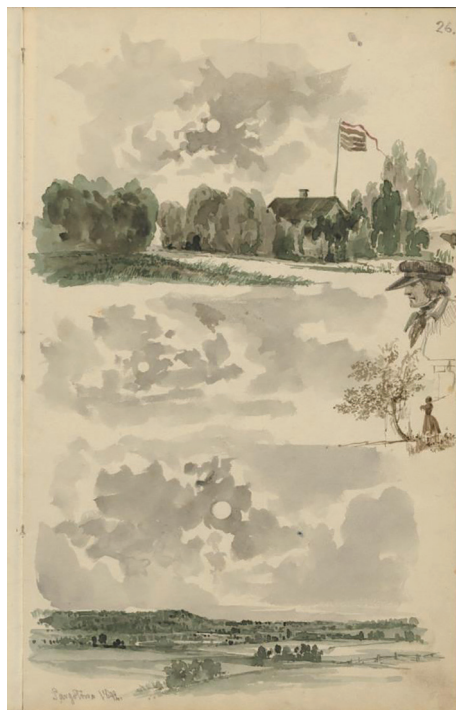
3 pav. A. Žametas. Piešinys iš studijinių piešinių albumo, 1842. LMAVB RS. F. 320. B. 78. L. 26