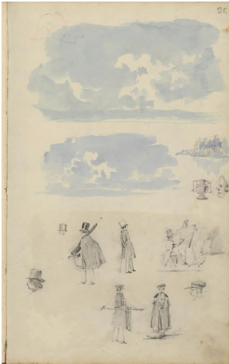
4 pav. A. Žametas. Peizažas. Piešinys iš studijinių piešinių albumo. LMAVB RS. F. 320. B. 78. L. 24