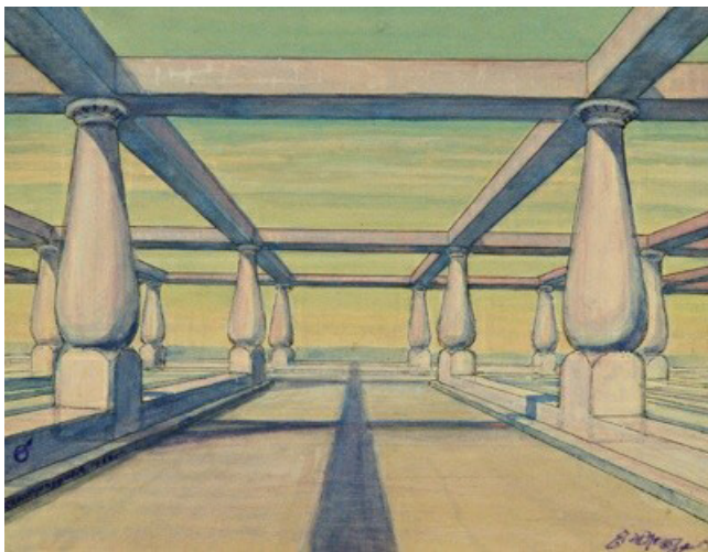
Язеп Дроздович. На экваторе. Академия. Марсианская школа под открытым небом. 1932. НХМ РБ

Дроздович ставит перед собой задачу задокументировать, детально зафиксировать до малейших мелочей все, что увидел во время своих путешествий. Иногда даже создается впечатление, что эти заметки он делает исключительно для себя самого, чтобы после зарисовать все увиденное. Но есть определенные детали (например, подстрочные