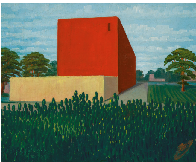
Язеп Дроздович. Астран. Обсерватория. 1931. НХМ РБ Jazepas Drozdovičius. Astranas. Observatorija. 1931. BRNDM