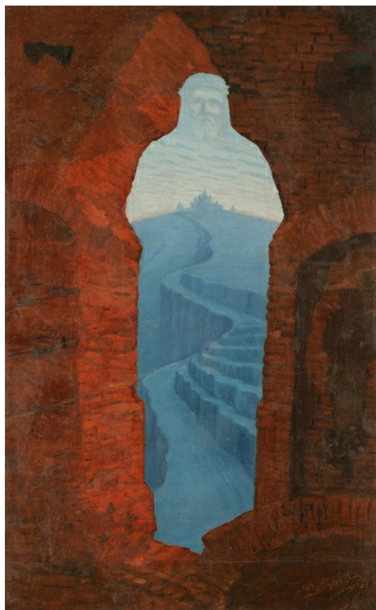
Язеп Дроздович. Пророк. 1931. НХМ РБ Jazepas Drozdovičius. Pranašas. 1931. BRNDM

1921 годом датирована и самая знаменитая живописная картина Дроздовича «Погоня», или