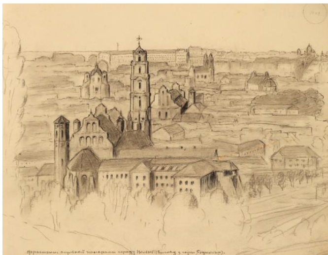
Язеп Дроздович. Рисунок из альбома «Вильня». 1930. НХМ РБ Jazepas Drozdovičius. Piešinys iš albumo „Vilnius“. 1930. BRNDM

большинство из них (которые «имеют определенное отношение к истории Литвы» и те, что якобы «не имеют отношения ни к белорусской, ни к литовской истории») остались в Вильно, меньшинство – попало в Минск. Например, все тексты с документацией «космических путешествий» Дроздовича хранятся сейчас в Центральной Библиотеке Врублевских Академии наук Литвы.