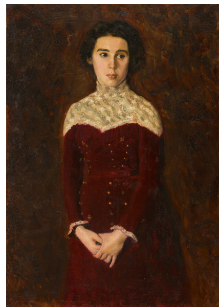
Лев Альперович. Портрет девушки в красном платье. ~1900–1905. НХМ РБ

Levas Alperovičius. N. Bonč-Osmolovskio portretas. 1909. BRNDM