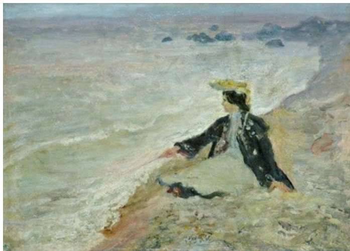
Лев Альперович. Женщина у моря. 1905. НХМ РБ Levas Alperovičius. Moteris prie jūros. 1905. BRNDM

Годом ранее, в 1909 г., вернулся из Парижа в Минск и художник Бонч-Осмоловский. Альперович выставил в Минске на выставке в Коммерческом училище его большой портрет в готическом кресле, привлекая всеобщее внимание. Год его написания неизвестен. Возможно, что выставленный в 1906 г. «Портрет студента»,