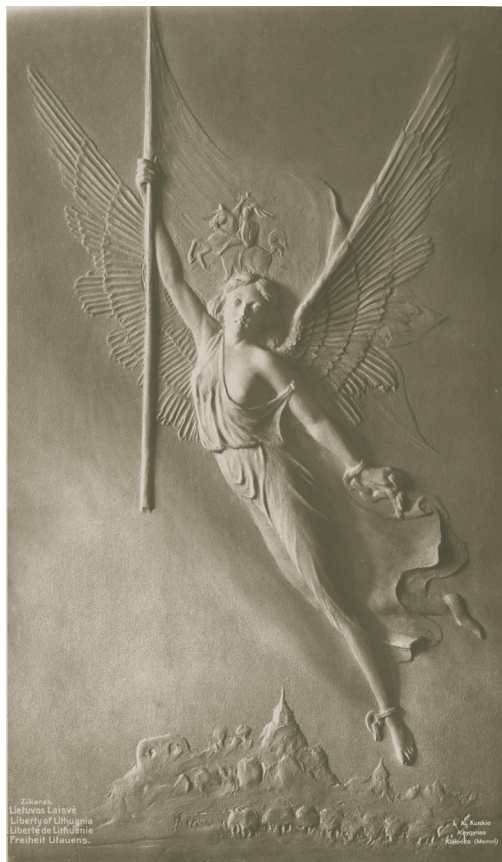
8 pav. J. Zikaras. Lietuvos laisvė, apie 1920. Atvirukas.