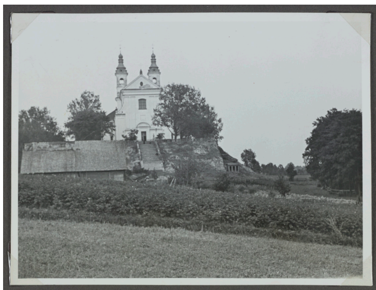
5 pav. Vygrių Švč. Mergelės Marijos Nekaltojo Prasidėjimo bažnyčia, 1937. Fotografija