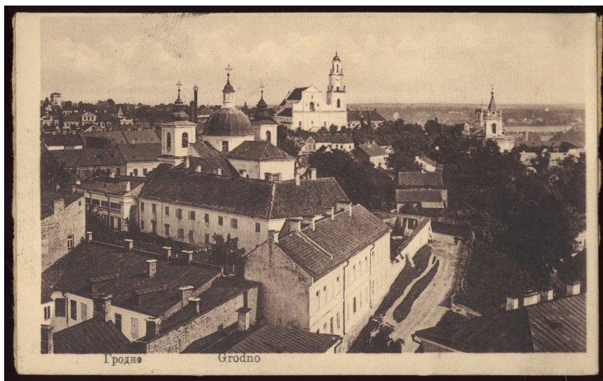
1 pav. Gardino Švč. Mergelės Marijos Gimimo cerkvė ir bazilijonių vienuolynas, 1915. Atvirutė ( Biblioteka Narodowa , sygnatura: Pocz. 13692)

Vienintelis išlikęs objektas 42 , kurio statyboje dalyvavo Domenico Fontana, yra Gardino bazilijonių Švč. Mergelės Marijos Gimimo cerkvė (1, 2 pav.), statyta 1720–1726 metais. 1751 m. greta pristatytas naujas mūrinis L formos vienuolyno