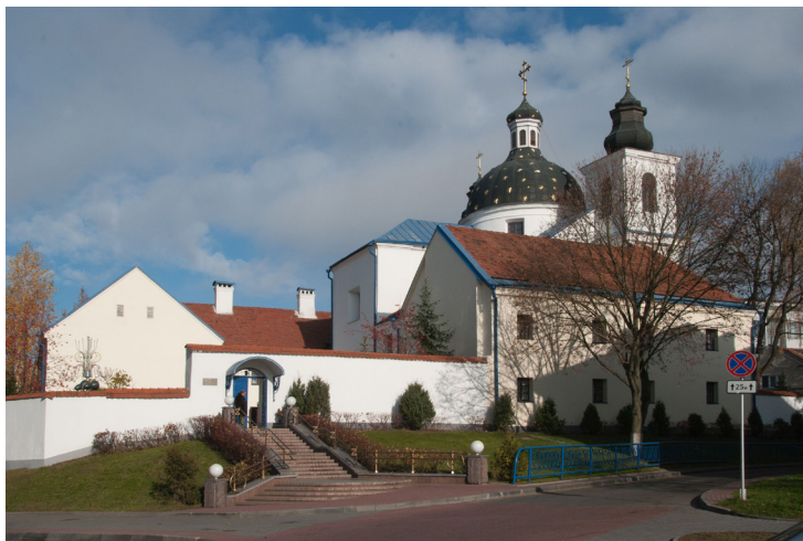
2 pav. Gardino Švč. Mergelės Marijos Gimimo cerkvė ir buvusio bazilijonių vienuolyno ansamblis.