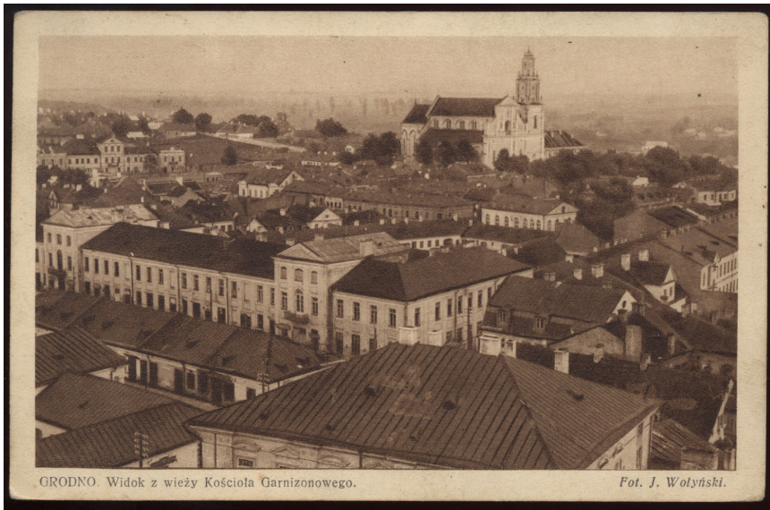
4 pav. Radvilų rūmai Gardine, 1930. Atvirutė. Vaizdas nuo Švč. Mergelės Marijos bažnyčios bokšto. Fot. J. Wołyński ( Biblioteka Narodowa , sygnatura: Pocz. 13693)

architektūrinės puošybos 49 . Tai liudytų, jog ir čia Domenico braižas išliko santūrus, lakoniškas, o pastato būta griežtų geometrinių formų.