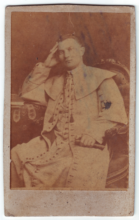
8 pav. Vilniaus vyskupas K. Hrynevickis. 10,2 × 6,5. Be fotoateljė įrašo. XIX a. 9–10 deš. KAKA . Al. 139, fotografija 2