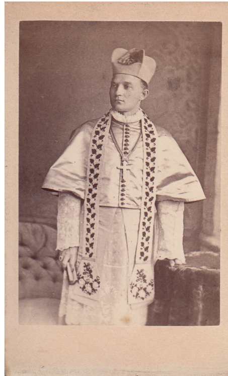
9 pav. Vilniaus vyskupas K. Hrynevickis. 10,2 × 6,5. Be fotoateljė įrašo. XIX a. 9–10 deš. KAKA . Al. 4. L. 4, fotografija 9

kitam valdžios atstovui – policmeisteriui – Vilniaus generalgubernatorių pavadino „kvailiu“, prisidėjo prie sprendimo jį ištremti. Beje, jau tuo metu vyskupas teigė, kad jis ir ištremtas liks Vilniaus vyskupu 40 , nors tremtimi jam dar niekas negrasino. Visa tai kūrė nepalaužiamo – tiesaus ir teiaus – vyskupo reputaciją tarp katalikų, o valdžios akyse K. Hrynevickis buvo „garbėtroška“, itin sureikšminęs savo vaidmenį ir neliečiamumą 41 . Galbūt tokiai nuomonei susiformuoti „padėjo“ ir aukso dulkėmis barstytas vyskupo parašas 42 – retas XIX a. pabaigos biurokratijoje. Iškalbingas aukšto savo statuso vertinimo pavyzdys.