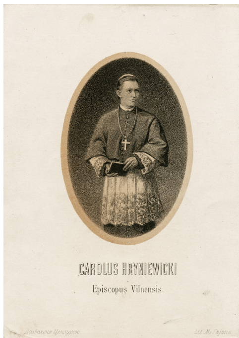
6 pav. Vilniaus vyskupas K. Hrynevickis. Litografija, 15,7 × 11. M. Fajansas, XIX a. 9 deš. LDM. G 21409