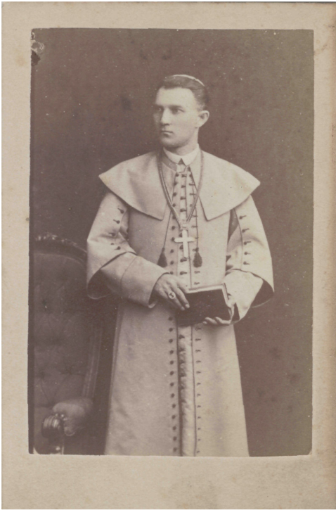
1 pav. Vilniaus vyskupas K. Hrynevickis. 10,9 × 6,8. Be fotoateljė įrašo. XIX a. 9–10 deš. KAKA . Al. 4. L. 5, fotografija 13

stačiakampis 23 buvo platinami Sankt Peterburge ant Stanislovo Savickio fotoateljė fotokortelės 24 . Kunigas Povilas Januševičius ją įsigijo 1895 m. gegužės 1 d., kai K. Hrynevickis jau nebuvo Vilniaus vyskupu ir net negyveno Rusijos imperijoje. Reikšminga, kad atminimas apie šį vyskupą buvo svarbus kunigui P. Januševičiui, ir XIX a. pab. vyskupo atvaizdas – vis dar prekė, iškalbinga bei atpažįstama ir Sankt Peterburgo katalikiškai visuomenės daliai.