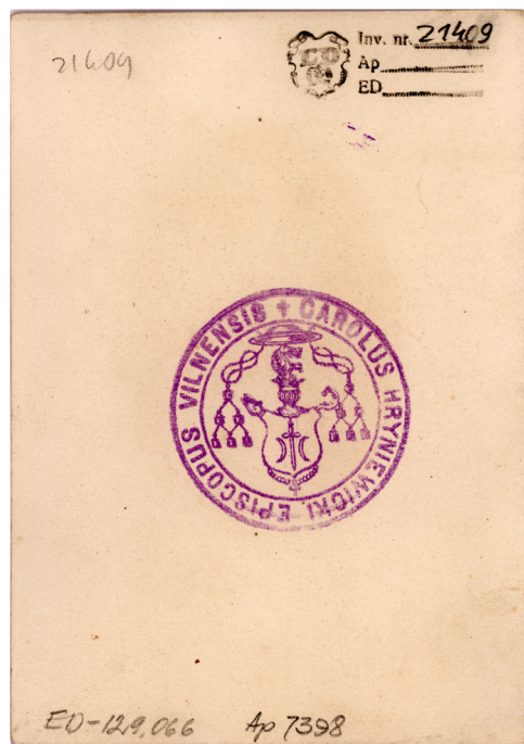
7 pav. Vilniaus vyskupo K. Hrynevickio litografijos verso pusė su vyskupo herbo atvaizdu. LDM. G 21409

stovinčio su knyga 35 (žr. 1 pav.) ir ant minkštakrėslio sėdinčio vyskupo fotografijos 36 (8 pav.). Iš jų pagamintas carte de visite formato portretines vyskupo fotografijas 37 jau minėjome. Žinoma ir dar viena fotografija be fotoateljė ženklų – vyskupas liturginiais rūbais (ir stula) 38 (9 pav.).