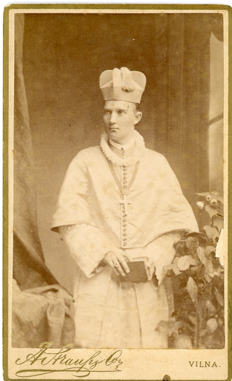
4 pav. Vilniaus vyskupas K. Hrynevickis. 10 × 6,2. A. Štrauso (Strauss) fotoateljė. XIX a. 9 deš. VDKM. III-16093

serijos fotografijas, nors apie vieną – tik iš leidinio iškarpos 32 . Vienos cabinet portrait formato fotografijos 33 verso pusė antspauduota Vilniaus vyskupo herbo antspaudu. Ar fotografija su vyskupo herbo antspaudu galėjo būti pardavinėjama, ar tai nuoroda į jos savininką? Kita vertus, M. Fajanso litografija – vyskupas liturginiais rūbais – taip pat antspauduota vyskupo herbo antspaudu 34 (6–7 pav.). Ši cenzūros leista litografija turėjo būti viešam naudojimui ir platinimui skirtas kūrinys. Galbūt ji antspauduota po įsigijimo, gal tai vyskupui priklausęs egzempliorius?