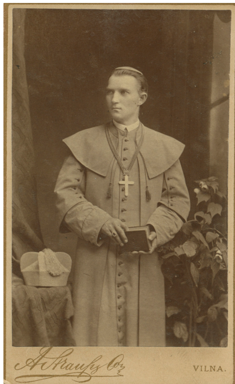
3 pav. Vilniaus vyskupas K. Hrynevickis. 10,3 × 6,2. A. Štrauso (Strauss) fotoateljė. XIX a. 9 deš. LNM. ATV 4589

giniais rūbais (taip pat stovintis 30 (4 pav.) ir sėdintis 31 (5 pav.). Fotoateljė rekvizitai (draperija, gėlės) leidžia teigti, kad fotografuota tuo pačiu metu. Žinome penkias šios