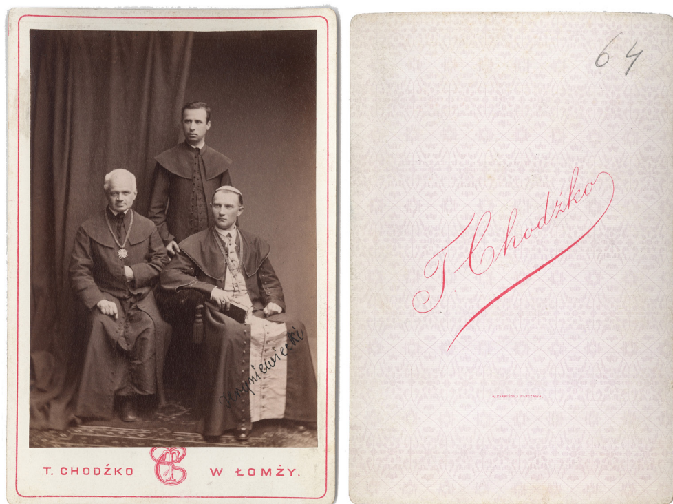
10 pav. Vilniaus vyskupas K. Hrynevickis su Seinų vyskupijos dvasininkais [?]. 16,3 × 10,7. T. Chodźkos (Chodźko) fotoateljė Lomžoje. XIX a. 9 deš. LVI A . F. 1135. Ap. 10. B. 83, fotografija 64

stula 43 „simbolizuoja nemirtingumo rūbą, ji yra vizualus kunigo galios pareiškimas, simbolizuojantis, kad žmogus, kuris ją dėvi, turi teisę teikti sakramentus“ 44 .