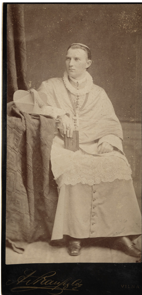
5 pav. Vilniaus vyskupas K. Hrynevickis. 20,9 × 10,1. A. Štrauso (Strauss) fotoateljė. XIX a. 9 deš. LDM. Fi-1534/3

Galima teigti, kad buvo atlikta ir daugiau vyskupo fotografijų serijų, tačiau fotografijos neturi fotoateljė įrašų. Iš vilkimų rūbų ir rekvizito matyti, kad vienlaikės yra