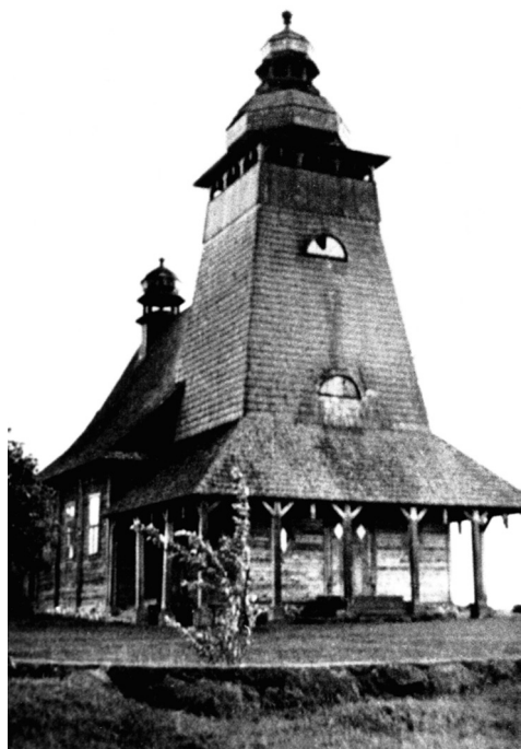
2 pav. Arnionių Švč. Mergelės Marijos koplyčia, XX a. 4–5 deš.