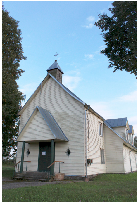
1 pav. Arnionių Švč. Mergelės Marijos koplyčia, 2014.

Apie tai, kad maldos namų Arnionyse būta nuo seno, dar XIX a. pab. užsiminė