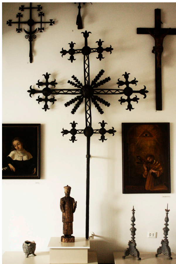
5 pav. Senosios Arnionių koplyčios kryžius, 2011.