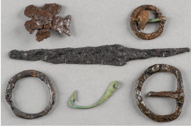
2 pav. Įkapės iš kapo Nr. 27.

geležies amžiaus iki pat naujųjų amžių. Viduramžiais tokie peiliai buvo dedami ir į vyrų, ir į moterų kapus. Prie diržo ar juostos peiliai buvo nešiojami odinėse, retai – medinėse makštyse.