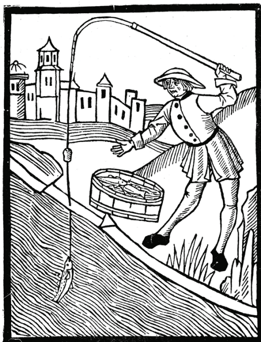
5 pav. Viduramžių žvejys su meškere ( The Book of Saint Albans , 1496. www.medievalists.net )

Žvejyba su meškere buvo populiari viduramžių Europoje (5 pav.), įskaitant ir Lietuvą. Žvejybiniai kabliukai aptinkami viduramžių miestų ir mažesnių gyvenviečių