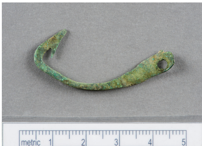
4 pav. Žvejybinis kabliukas iš kapo Nr. 27.

straipsnio autoriaus publikacijose klaidingai buvo nurodoma, kad kabliukas yra žalvarinis (žalvaryje pagrindinis metalas yra varis, o legiruojantis metalas – cinkas). Radinio cheminės sudėties analizę atliko Simonas Senulis (Trakų istorijos muziejus).