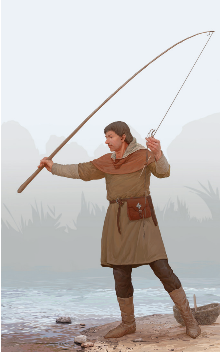
6 pav. Viduramžių žvejys iš Paūdronių (rekonstrukcinis piešinys). Manvydo Vitkūno rekonstrukcija, dailininkas Šarūnas Miškinis

Remdamiesi archeologiniais šio kapo radiniais, straipsnio autorius kartu su dailininku Šarūnu Miškiniu parengė viduramžių žvejo iš Paūdronių rekonstrukcinį piešinį (6 pav.) (*).