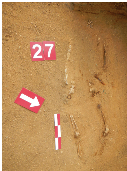
1 pav. Paūdronių kapinyne kapas Nr. 27. Bendras vaizdas.

Geležinis įtveriamasis peilis (inv. Nr. AP799) tiesia nugarėle 144 mm ilgio, įtvaros ilgis – 49 mm. Geleztės plotis nugarėlėje – 4 mm, geleztės aukštis – nuo 8 (per 1 cm nuo smaigalio) iki 18 mm (ties įtvare), įtvaros aukštis – nuo 5 iki 10 mm. Koto, kuris veikiausiai buvo medinis, pėdsakų neaptikta. Šis peilis – universalios formos, žinomos nuo