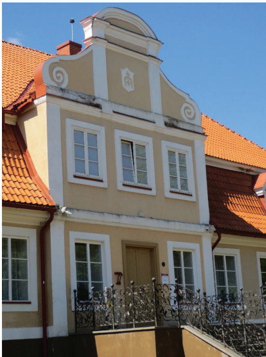
3 pav. Gruževskių giminės herbas „Lubičas“ (lenk. Lubicz ) virš įėjimo į XVIII a. pabaigoje statytus Gruževskiams priklausiusius Kelmės dvaro rūmus. Šiuo metu pastate veikia Kelmės krašto muziejus (Jasiūnienės nuotr., 2020)

Antra, analizuojant Kelmės krašto muziejaus internetinės svetainės medžiagą bei ekspozicijas, pastebėta, kad Gruževskių „Lubičo“ herbas yra tapęs svarbiu muziejaus simboliu. Internetinėje muziejaus svetainėje, aprašant Kelmės dvaro istoriją, pateikiama Gruževskių herbo iliustracija (4 pav.). Tokia pati herbo iliustracija demonstruojama ir lauke bei viduje esančiuose stenduose, pagrindinėje muziejaus ekspozicijos salėje pirmajame aukšte (5 pav.). Reikia paminėti, kad šioje medžiagoje pateikiamas tik herbo vaizdas, platesnės informacijos apie jį nėra. Manytina, kad muziejaus lankytojams būtų įdomu ir naudinga pamatyti ne tik spalvotas herbo iliustracijas, tačiau ir autentiškų Gruževskių giminės heraldikos šaltinių vaizdus. Tai ugdytų kritišką lankytojų požiūrį, formuotų istorinę