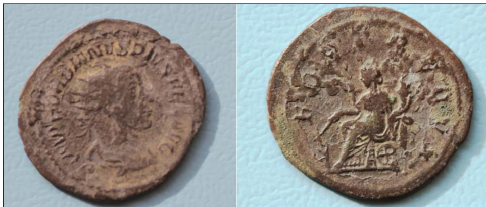
2 pav. Gordiano III (238–244 m.) moneta. Aversas ir reversas

buvo palaikomas dirbtinai. Svarbiausias išorinis monetos požymis, pagal kurį ji lengvai atpažįstama, – ne su lauro vainiku, bet su spinduline karūna pavaizduotas imperatorius.