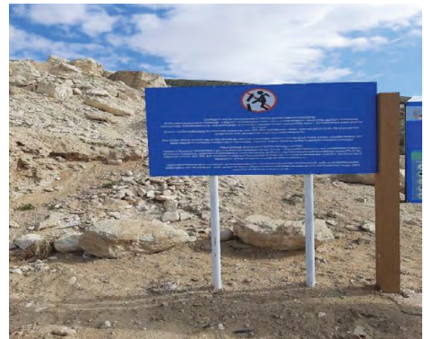
9 pav. „Branginkite ir saugokite!“, Aktau, uolų takas palei Kaspijos jūrą, 2021.

Viešoji erdvė nebepriklausydavo žmonėms, ji tapdavo parodomąja vizitine kortele, vienas atvejais tvarkinga ir gražia žiurint iš toli (ir nematant, kad žolė yra dažyta), kitais atvejais grožis atsiskleidavo tik iš labai arti, nes žvelgiant iš toliau, vaizdą užgoždavo didelio formato draudžiamieji viešieji ženklai.