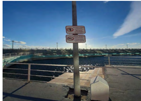
18 pav. „Šiukšlių į baseiną nemesti! Maudytis draudžiama!“, Aktau, erškėtams auginti skirtas baseinas šalia Kaspijos jūros, 2021.