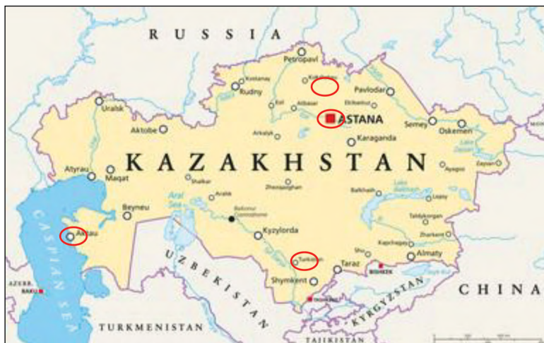
1 pav. Vietovės Kazachstane, kuriose buvo vykdomas empirinis tyrimas.