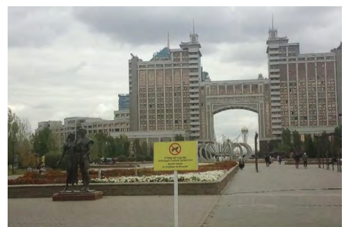
20 pav. „Vedžioti šunis ant vejos draudžiama!“, Astana, miesto centras, 2019. Nuotrauka iš asmeninio archyvo