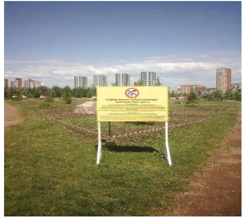
7 pav. „Draudžiama rauti gėles!“, Astana, miesto parkas, 2021.