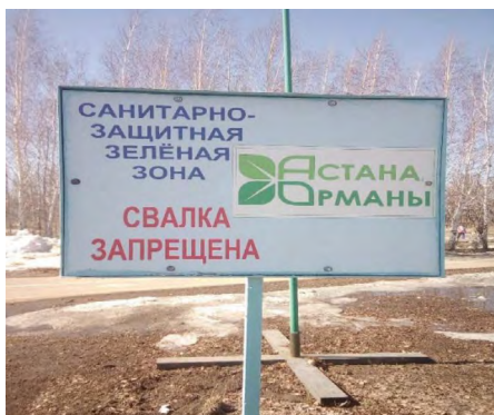
21 pav. „Draudžiama pilti šiukšles“, Astana, parkas priemiestyje, 2021.