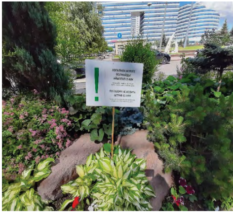
6 pav. „Po veją nevaikščioti!“, Astana, gėlynas miesto centre, 2020.