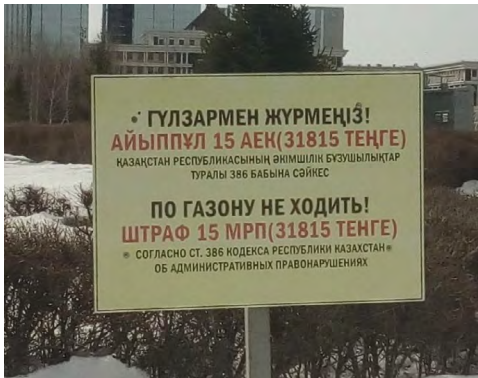
8 pav. „Po veją nevaikščioti!“, Astana, miesto centras žiemą, 2020.