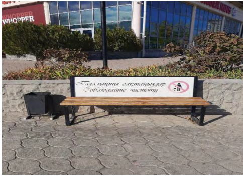
10 pav. „Laikykites švaros!“, Aktau, suoliukas miesto centre, 2021.