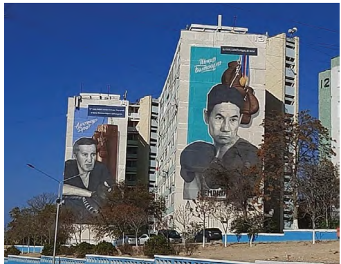
5 pav. Mėlynai dažyti gatvės atitvarai ir daugiaaukščių namų fasadai. Aktau, 2021.

ją tarsi išrikiuoja griežto viešosios erdvės estetikos kanono paradui ir „įrėmina“ pageidautiną individų ir socialinių grupių elgesį joje.