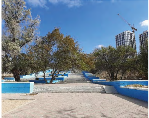
3 pav. Mėlynai dažytos cementinių laiptų dalys. Aktau, miesto centras, 2021.