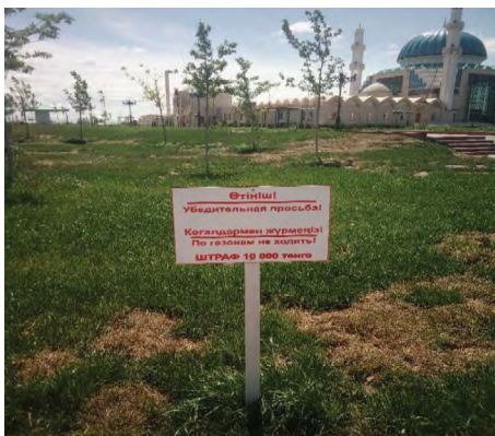
12 pav. „Po žolę nevaikščioti!“, Turkestanas, miesto istorinis centras, 2021.

Tekstinių ženklų tyrimui svarbi yra teksto kalbos fiksacija: kokia kalba ir keliomis kalbomis yra parašytas tekstas ženkle. Kazachstane yra plačiai vartojama rusų kalba, todėl didžioji dalis viešųjų ženklų, kuriuos pavyko pamatyti ir užfiksuoti tyrimo metu, buvo dvikalbiai – parašyti rusų ir kazachų kalbomis, tačiau buvo ir tokių, kurie buvo parašyti tik rusų kalba. Ženklai, kuriuose būtų naudojama anglų kalba, matomi ypač retai ir tik turistų labiausiai lankomose vietose. Vienas tokių anglų kalba parašytų ženklų, nurodančių konkrečią piniginę