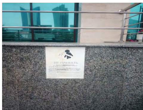
16 pav. „Nesispjaudyti!“, Astana, maisto prekių parduotuvė miesto centre, 2020.