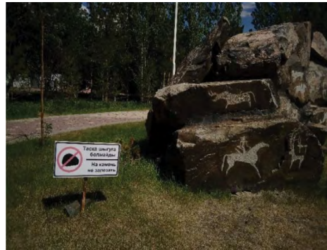
11 pav. „Ant akmens nelipti“, Astana, miesto parkas, 2020.

Kiek kitaip yra su draudžiančiais žolę mindyti ženklais, esančiais vejose miestų parkuose (žr. 12, 13 pav.). Nors ženklai lipti ant žolės draudžia ir numato pinigines baudas, šių taisyklių kartais yra nesilaikoma, nes egzistuoja nerašytos „taisyklių laužymo taisyklės“. Vis dėlto, su tokiais akivaizdžiais taisyklių laužymo pavyzdžiais tyrimo metu neteko daug susidurti. Dažniausiai ženklais draudžiamas elgesys buvo matomas ten, kur tokių ženklų nebūdavo.