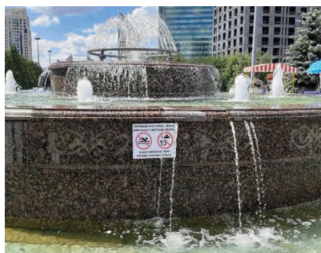
15 pav. „Fontanose maudytis draudžiama! Fontanų vandenį gerti draudžiama!“, Astana, miesto centras, 2020.