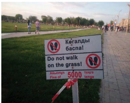
14 pav. „Do not walk on the grass!“, Turkestanas, miesto centras, 2021.

Kita vertus, priemiestiniuose parkuose yra ženklų, kurių neaptiksi sostinės centre. Čia draudžiama šiukšlinti ir medžioti (žr. 21, 22 pav.). Bet čia nėra ir ženklų, draudžiančių mindžioti veją, taip pat neteko aptikti ženklų, draudžiančių vedžioti šunis.