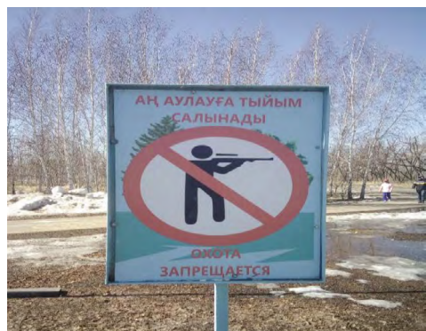
22 pav. „Medžioklė draudžiama“, Astana, parkas priemiestyje, 2021.