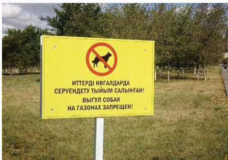
19 pav. „Vedžioti šunis ant vejos draudžiama!“, Astana, miesto parkas, 2019.