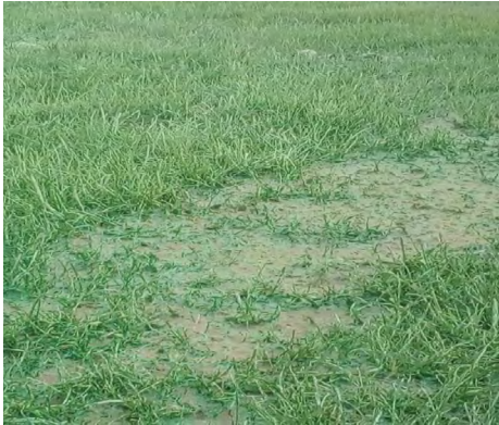
2 pav. Žaliais dažais dažyta žolė, Turkestanas, miesto centras prieš Prezidento atvykimą, 2021.