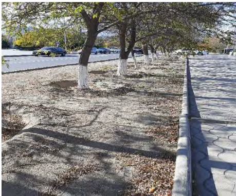
4 pav. Baltai dažyti medžių kamienai. Aktau, miesto centras, 2021.